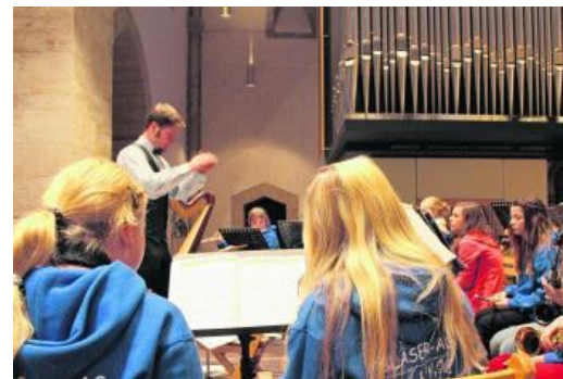
Orchester, Ausbildung an Instrumenten