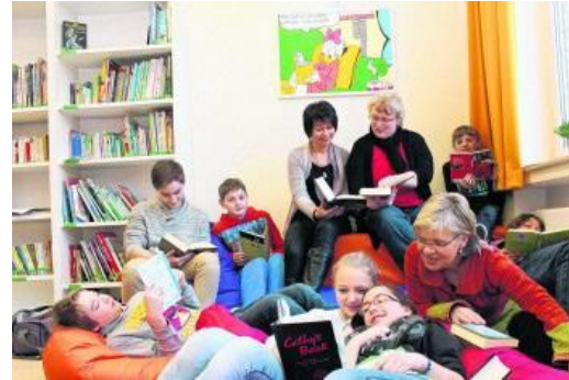
Einrichtung der Bibliothek