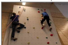
Klettern und Jazzdance